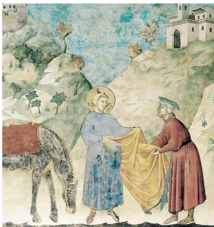
«Il dono del mantello» di Giotto, affresco della Basilica di Assisi